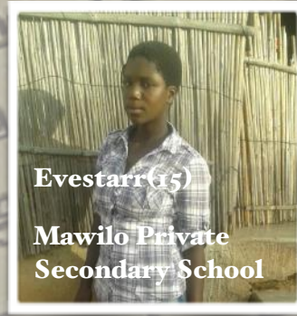
Evestarr (15) Mawilo Private Secondary School